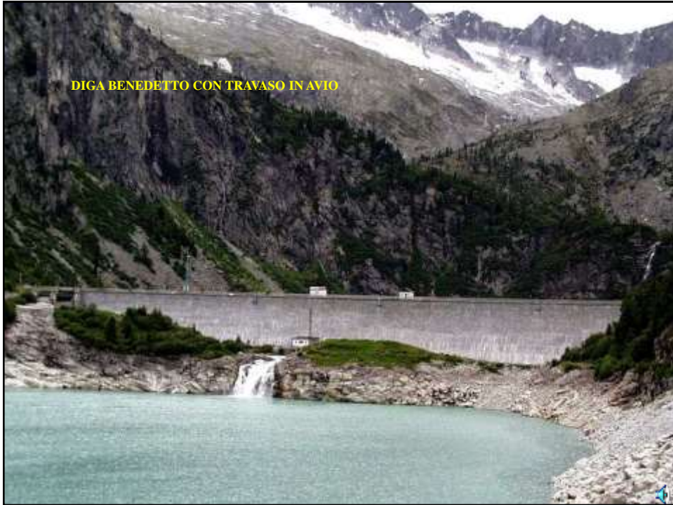
DIGA BENEDETTO CON TRAVASO IN AVIO