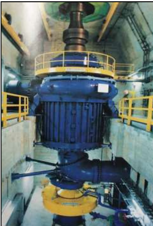
TURBINA VISTA ASSIEME