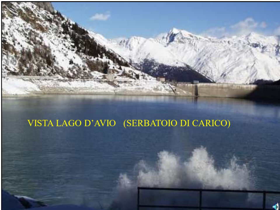
VISTA LAGO D'AVIO (SERBATOIO DI CARICO)