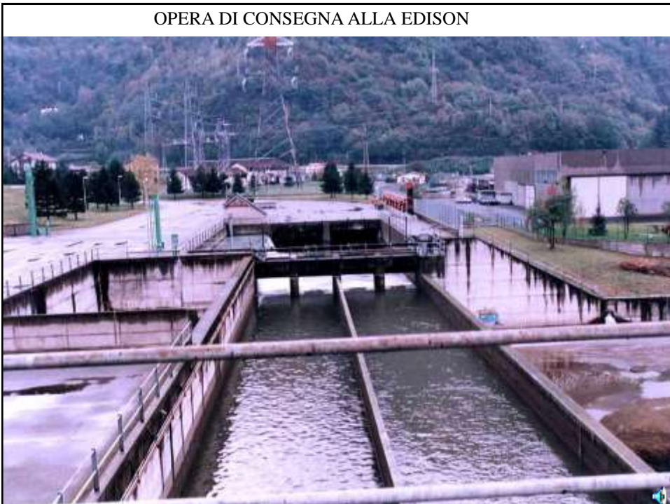
OPERA DI CONSEGNA ALLA EDISON