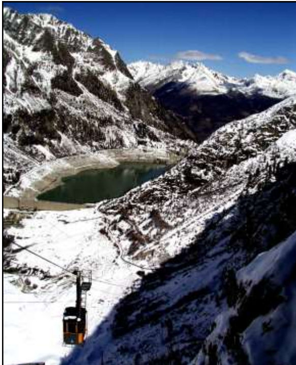
VISTA LAGO D'AVIO DA DOSSO-LAVEDOLE