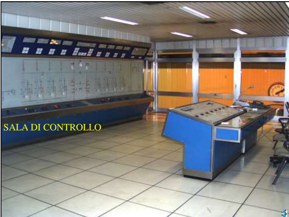
SALA DI CONTROLLO