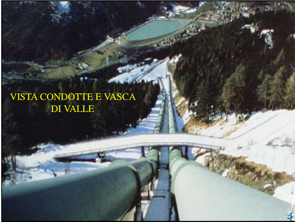
VISTA CONDOTTE E VASCA DI VALLE