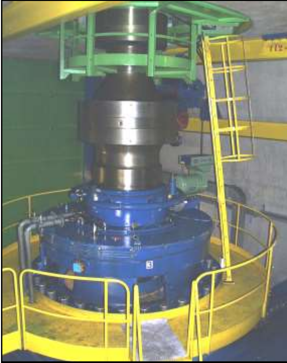
GIUNTO TURBINA ALTERNATORE