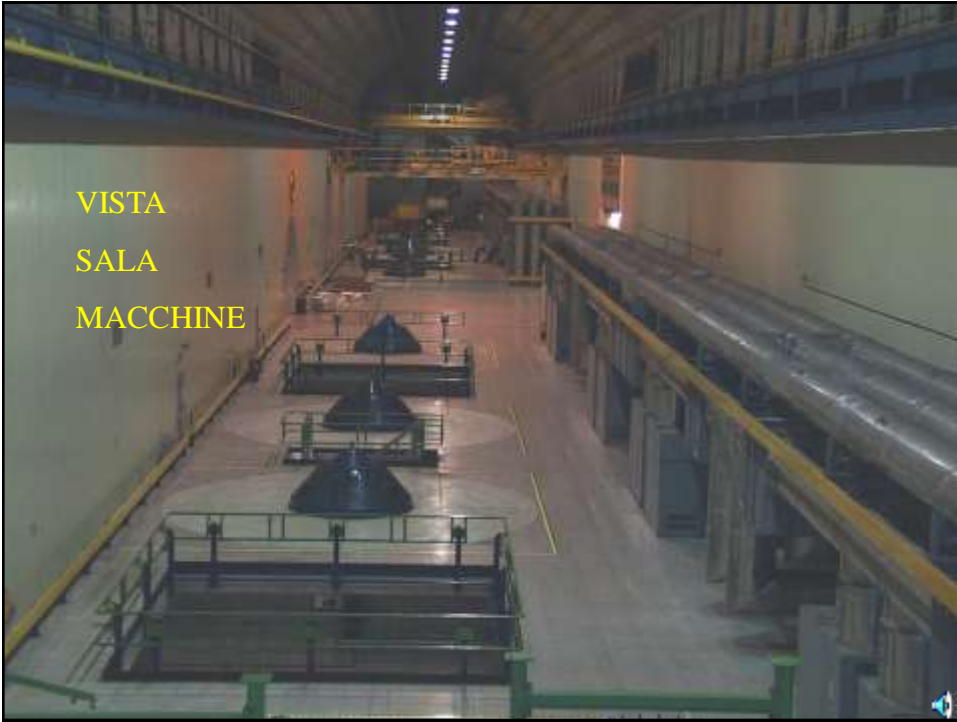
VISTA SALA MACCHINE