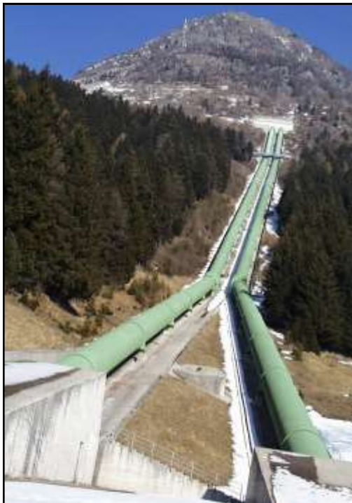
VISTA TRATTO SCOPERTO DELLE CONDOTTE FORZATE