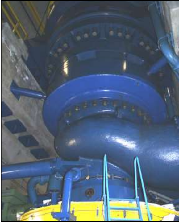
PARTICOLARE CASSA TURBINA